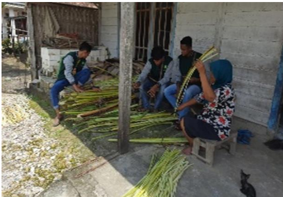
Persiapan bahan kerajinan pohon pisang