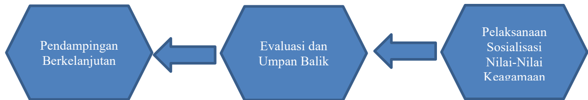
Diagram 1. Proses Pengabdian