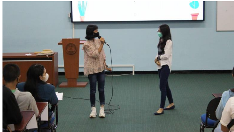
Gambar 3. Kegiatan Pengabdian Masyarakat dengan Pusat Pengembangan Anak (luring)

Setelah dilakukan pre-test selanjutnya dilakukan ice-breaker yang bertujuan untuk memperlancar hubungan dan pengenalan dengan partisipan (Gambar 3). Ice breaker melibatkan sebagian besar peserta. Setelah ice breaker , materi diberikan dengan menggunakan konsep gamification yaitu dengan bantuan video dan berbagai permainan dengan aplikasi quizziz . Konsep gamification dapat membantu membuat diskusi menjadi lebih menarik, meningkatkan interaksi dengan peserta, dan mempermudah partisipan memahami materi yang diberikan (Cahyono, et al. 2022).