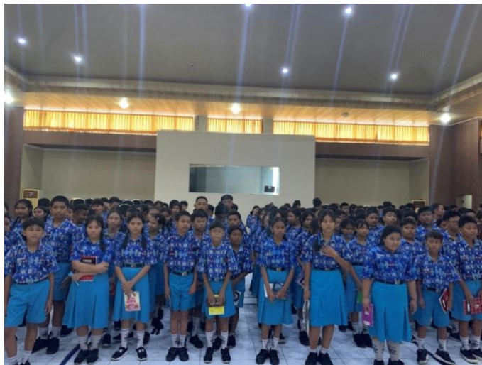
Gambar 3. Pelaksanaan sosialisasi “Kenali Batas, Jaga Diri” kepada siswa SMP Nasional Denpasar

Pelaksanaan sosialisasi edukasi mengenai bagian tubuh pribadi diselenggarakan sebagai tindak lanjut atas hasil identifikasi kebutuhan preventif bersama pihak sekolah. Kegiatan ini dilaksanakan di aula SMP Nasional Denpasar dengan melibatkan 260 siswa kelas VII. Fokus utama penyampaian materi tidak sekadar melakukan transfer informasi, melainkan berupaya menciptakan ruang diskusi yang aman bagi remaja awal untuk mengenali konsep privasi tubuh yang sering kali dianggap tabu. Suasana awal kegiatan menunjukkan adanya kecanggungan dari peserta, yang merupakan respons wajar mengingat sensitivitas topik perlindungan diri di lingkungan sekolah menengah.