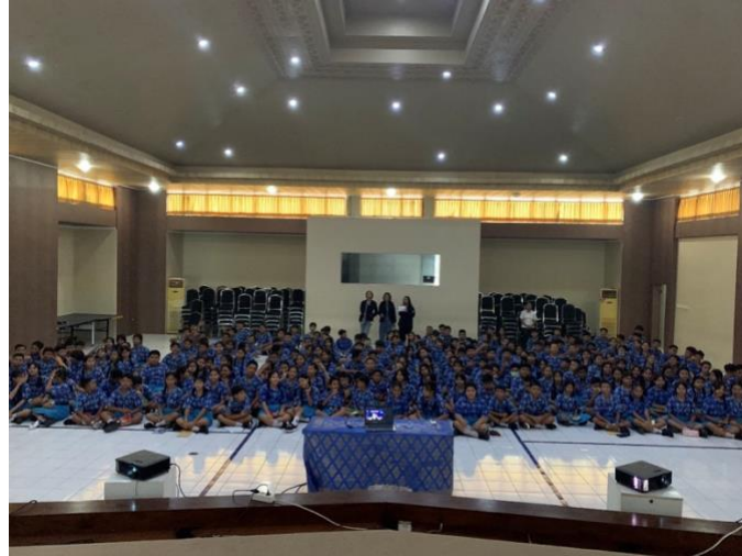
Gambar 5. Dokumentasi Peserta Dan Tim Pelaksana Setelah Kegiatan Sosialisasi