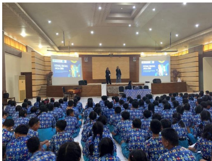
Gambar 4. Penyampaian Materi Edukasi Bagian Tubuh Pribadi Menggunakan Media Visual

Keberhasilan dalam memancing diskusi terbuka tersebut sangat didukung oleh pemanfaatan media visual yang tepat guna. Penggunaan ilustrasi yang proporsional pada salindia presentasi membantu siswa memvisualisasikan batas ruang privat tanpa merasa terintimidasi. Media visual berfungsi secara efektif sebagai perantara yang mereduksi beban emosional saat membahas ranah bagian tubuh pribadi di forum terbuka. Strategi fasilitasi visual semacam ini dinilai sangat direkomendasikan dalam intervensi berbasis sekolah untuk menjembatani penyampaian topik-topik perlindungan anak yang bermuatan sensitif (Bayer, 2025).