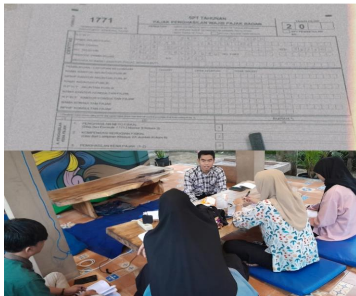
Gambar 2. Simulasi Pengisian SPT 1771