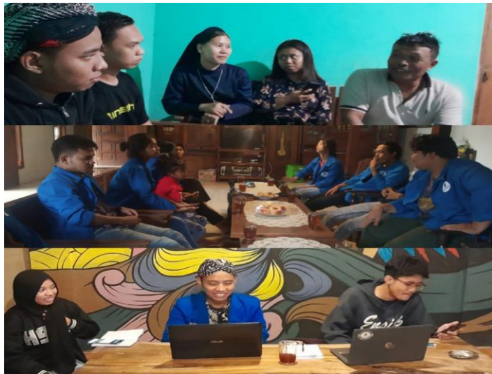
Gambar 1. Sesi Penyampaian Informasi (Ceramah) Mengenai Pelaporan SPT