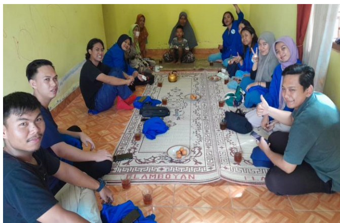
Gambar 4. Foto Bersama Kegiatan Pengabdian Masyarakat